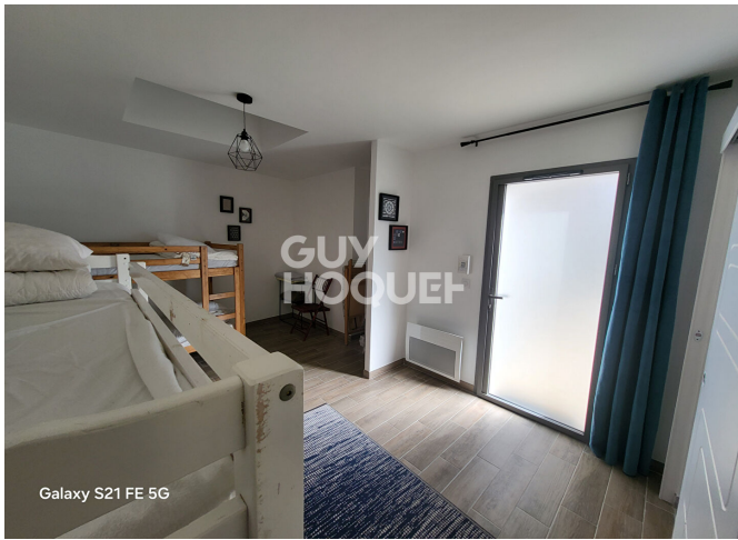
Galaxy S21 FE 5G