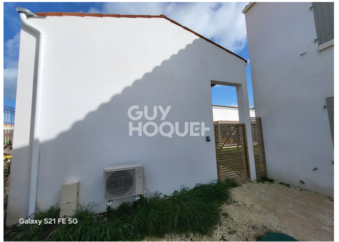
Galaxy S21 FE 5G