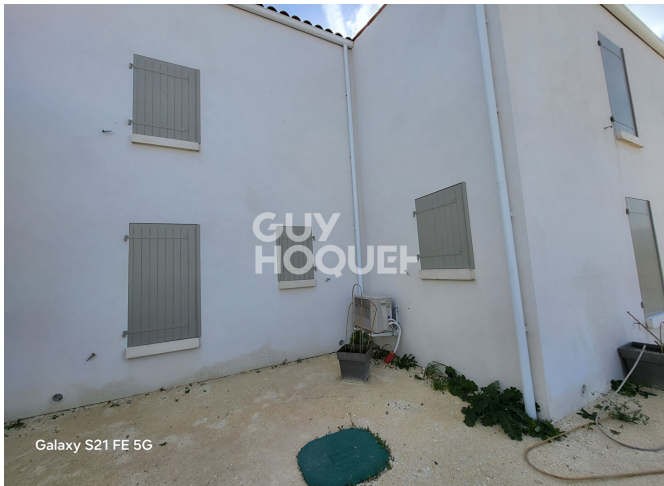
Galaxy S21 FE 5G