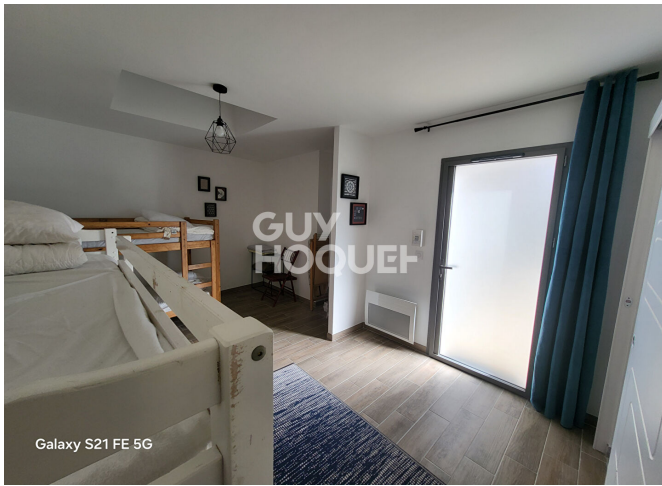
Galaxy S21 FE 5G