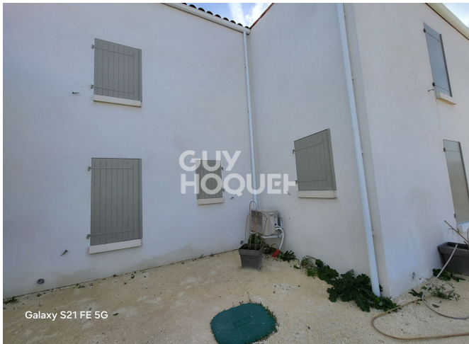
Galaxy S21 FE 5G