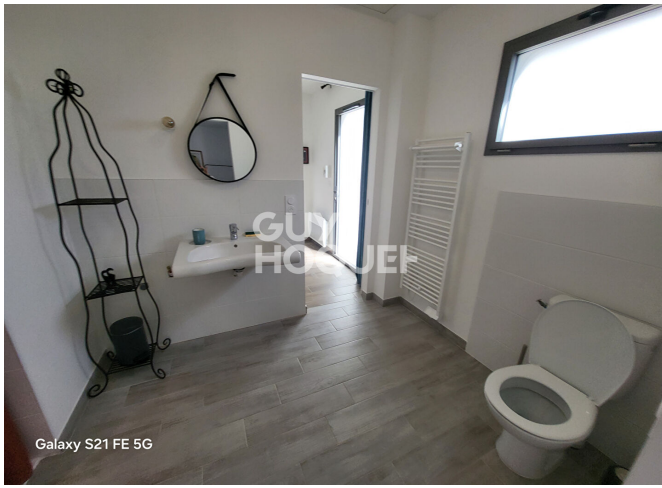
Galaxy S21 FE 5G